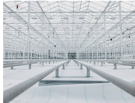
Bilder från byggnationen av växthuset i Frövi.